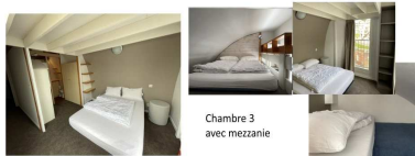
Chambre 3 avec mezzanine