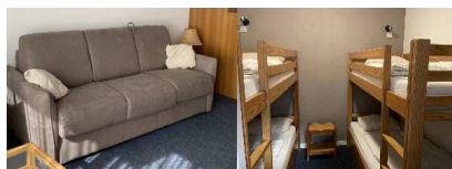
Studio 6 places - Le Chalet

Coin montagne: 2 lits superposés - 4 pl Séjour canapé lit 160 - 2 pl