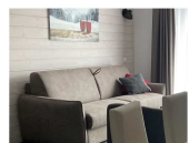
Les couchages: - séjour canapé lits 160 - coin montagne: 2 lits 90 - cabine : 2 lits 80