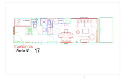
4 personnes Studio N° : 17