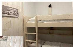
Séjour canapé lit 160 Coin nuit 2 lits superposés 90