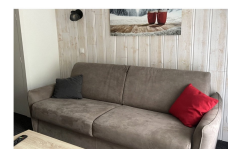
Les couchages: - Canapé lit 160 - 2 lits superposés 90